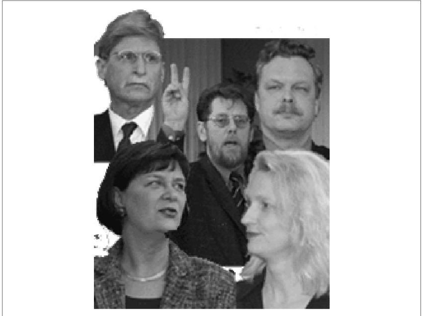
De vijf fractievoorzitters met in het midden de lijsttrekker van het CDA tijdens de beëdiging als raadslid. Hij zou gezegd kunnen hebben: "Ik zweer dat ik twee wethouders wil"

Veel leden van GroenLinks komen voort uit actiegroepen of hebben een idealistische achtergrond. Wij zijn de actie en de discussie gewend. Ik eindig er mee om jullie allemaal op te roepen om creatief te zijn en met ideeën en voorstellen naar me toe te komen over de manier waarop wij, als GroenLinks, ons in deze nieuwe periode zullen gaan opstellen. En nogmaals, bedankt voor de inzet en steun.